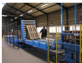
Ligne de Triage

Merci de cliquer sur l'une des photos ci-dessous pour voir nos machines.